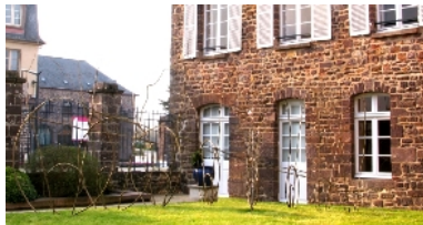
DR Pascale Planche

Atelier en famille le mercredi 24 avril de 10h à 12h. 3€ par personne. Réservation auprès de L'aparté.