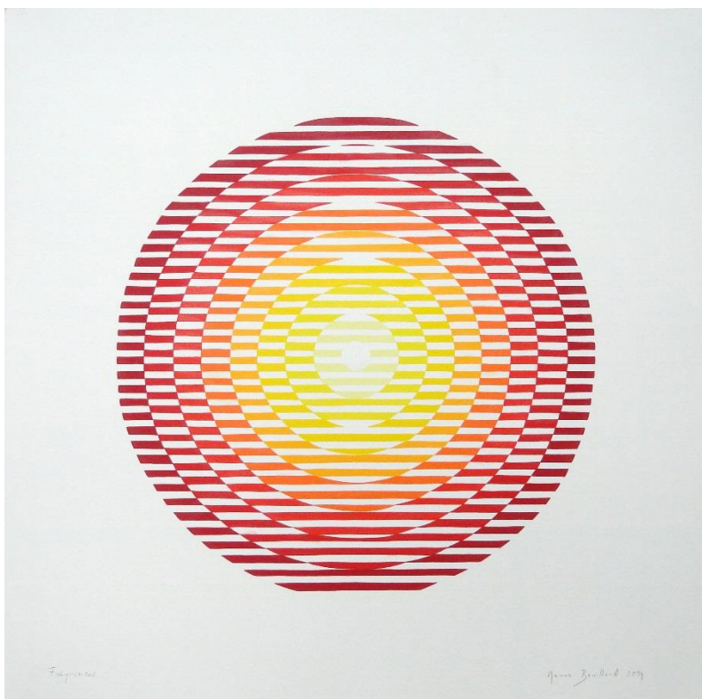
Marine Bouilloud, Fréquences , 2014. Acrylique extra-fine sur papier Montval 400 grammes, 50 x 50 cm.