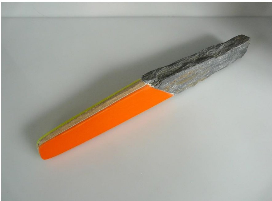
Sarah Lück, Travail en cours , pierre et plexiglas, 2019.