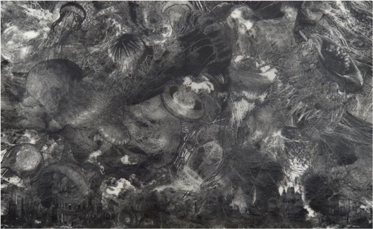
Quentin Montagne, Invasion , 2018. Encre de Chine sur papier calque. Détail.