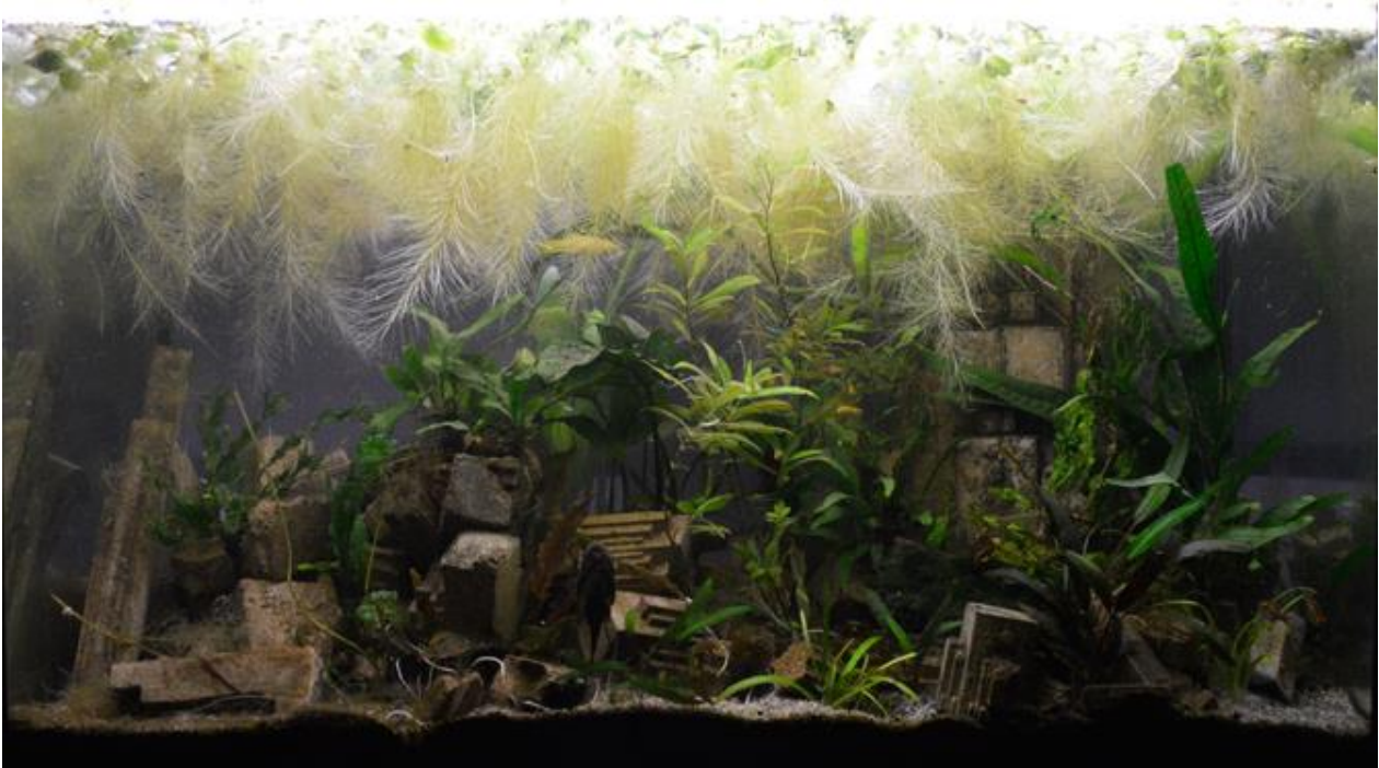
Quentin Montagne, Le désastre de Malévitch (cinquième état) , 2016.

Bois, ciment, sable, aquarium, poissons (Corydoras Paleatus, Ancistrus Temincki, Poecilia wingei, Xiphophorus maculatus, Chromobotia macracanthus, Hemigrammus bleheri, Hemigrammus erythrozonus et Paracheirodon innesi), plantes (Hygrophila corymbosa, Microsorium Windelov, Microsorium Pteropus, Cryptocoryne wendtii, Cladophora aegagropila, Sagittaria Eatonii, Anubias Barteri Nana, Anubias Barteri et Pistia Stratiotes), crustacés (Planorbella duryi), 156x80x35 cm.