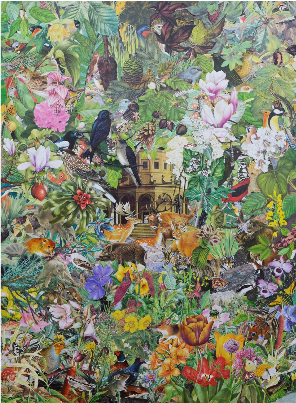
Quentin Montagne, Raphael Urbinas , 2019. Illustrations découpées et collées sur papier, 80 x 60 cm.