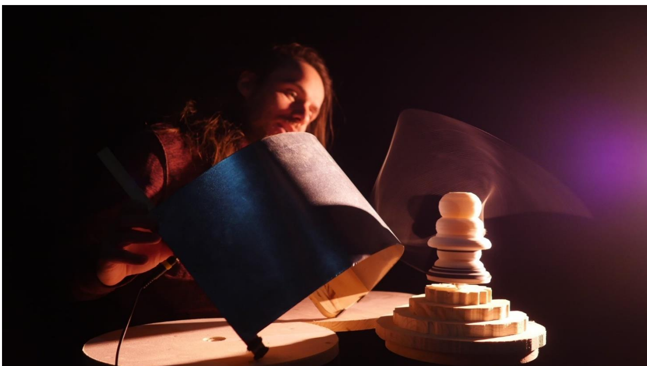
Les Phonotons (performance), série 1, 2022. Résidence à la Casba de L'Armada Productions, Saint-Erblon. Avec le soutien du Conseil départemental d'Ille-et-Vilaine, de la ville de Saint-Erblon, de Rennes Métropole et de L'Armada Productions.