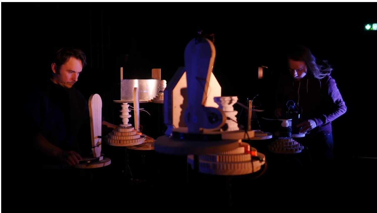
Les Phonotons (performance), série 1, 2022. Résidence à la Casba de L'Armada Productions, Saint-Erblon. Avec le soutien du Conseil départemental d'Ille-et-Vilaine, de la ville de Saint-Erblon, de Rennes Métropole et de L'Armada Productions.