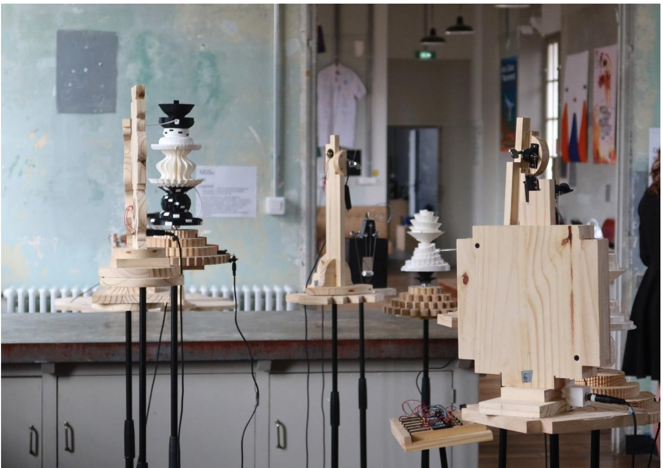
Les Phonotons , série 1, exposition à l'Hôtel Pasteur dans le cadre de Arts et Soins en Mouvement, Rennes, 2023. Avec le soutien du Conseil départemental d'Ille-et-Vilaine, de la ville de Saint-Erblon, de Rennes Métropole et de L'Armada Productions.