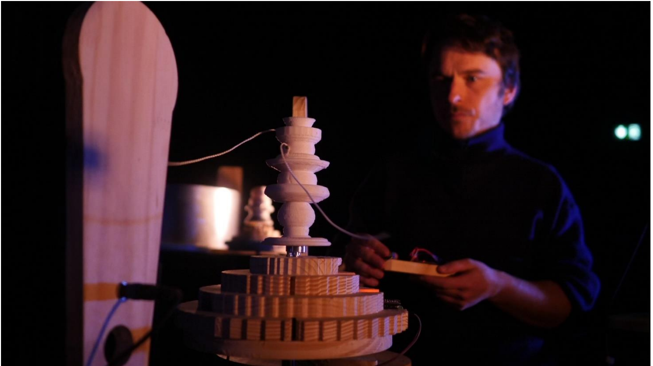
Les Phonotons (performance), série 1, 2022. Résidence à la Casba de L'Armada Productions, Saint-Erblon. Avec le soutien du Conseil départemental d'Ille-et-Vilaine, de la ville de Saint-Erblon, de Rennes Métropole et de L'Armada Productions.