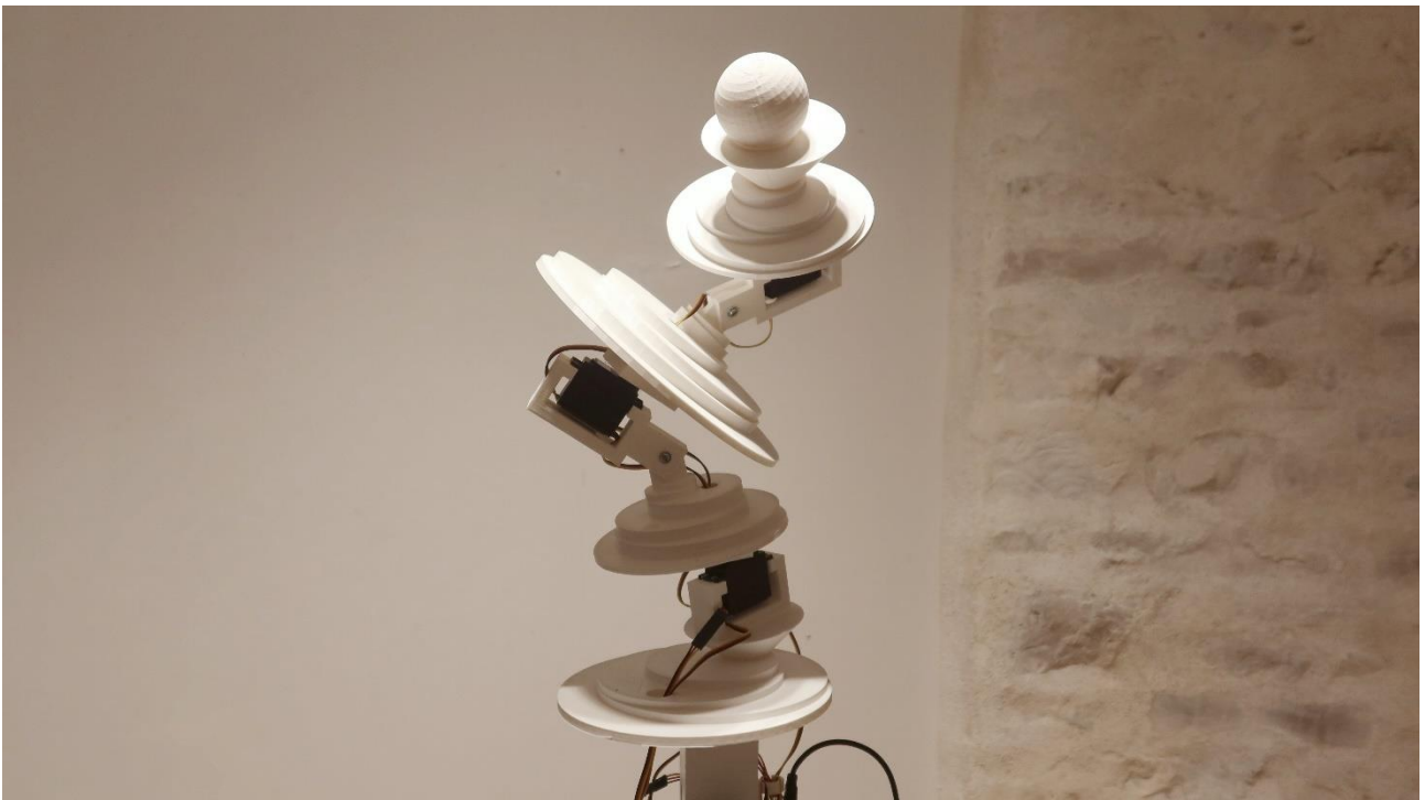
Mille au carré, Les flûtes et le fou , 2024

En résidence entre le 1 er décembre 2023 et le 16 février 2024 Exposition du 16 février au 3 mai 2024