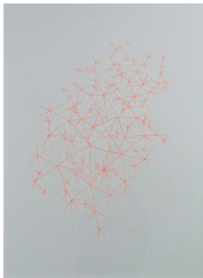
Yuna AMAND CaSO 4 -2H 2 O, 2012 Sérigraphies sur papier Rivoli, encre fluorescente orange 50 x 70 cm, encadrées sous verre 53 x 73 cm