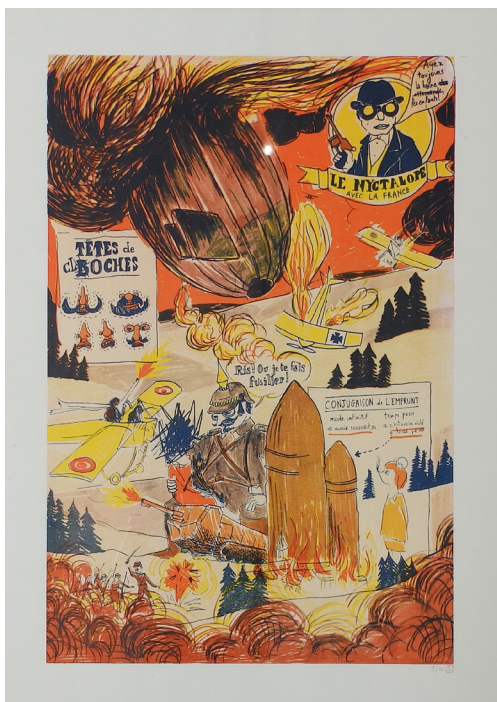
Julien LEMIERRE Sans titre, 2017 Sérigraphie, 50 x 70 cm