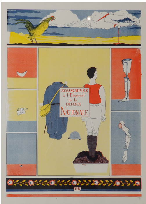
Anna BOULANGER Souscrivez à l'emprunt de la défense nationale Sérigraphie, 50 x 70 cm

Enfin, l'idée d'enfant orphelin est prédominante dans la composition de l'image avec ce mannequin de soldat au centre de l'image.