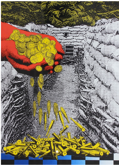
Loïc CREFF Champ d'Horreur, 2017 Sérigraphie sur papier Rivoli 240 gr., 50 x 70 cm