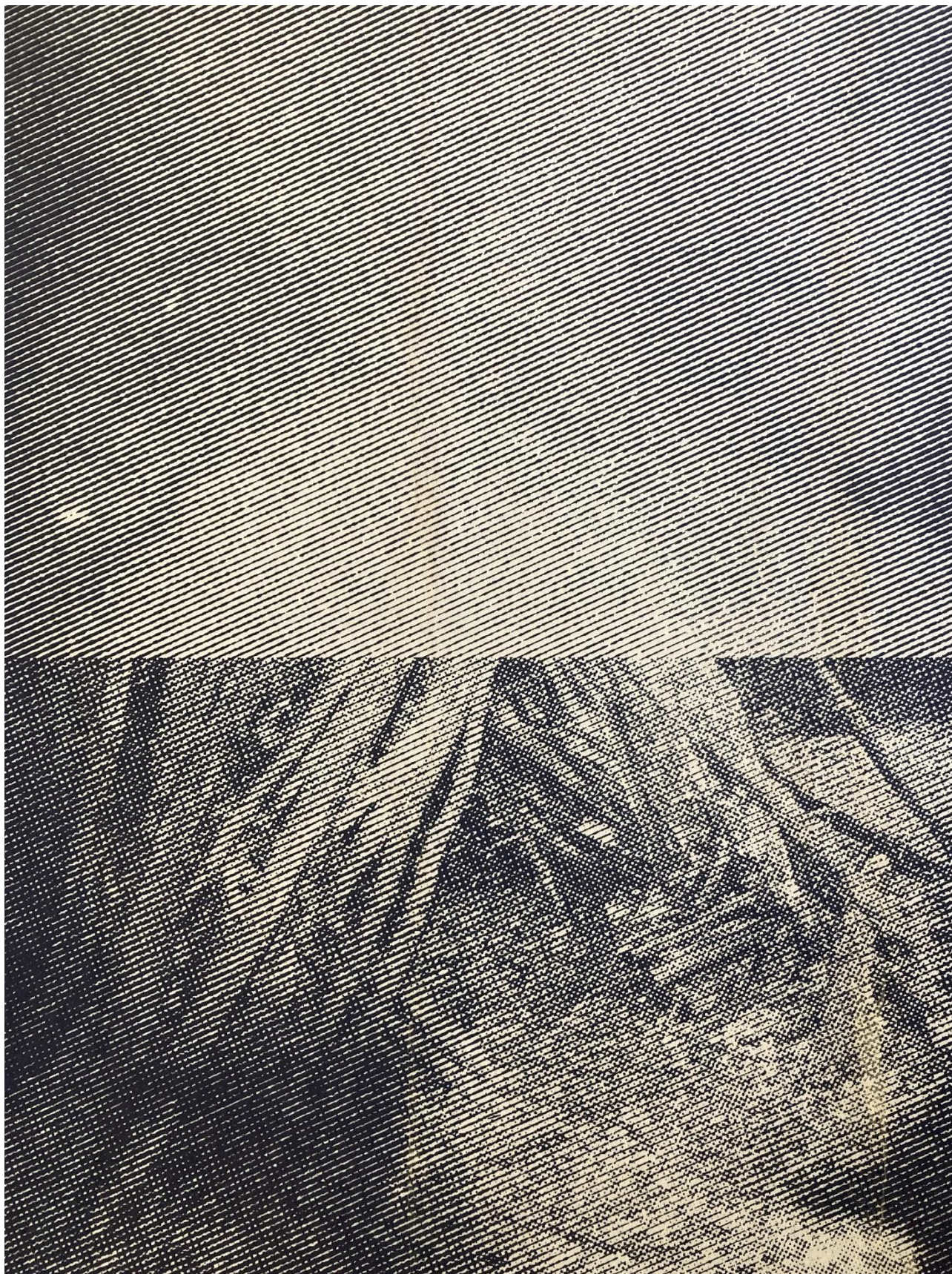
Nature , sérigraphie sur bois, 80 x 60 cm (détail)