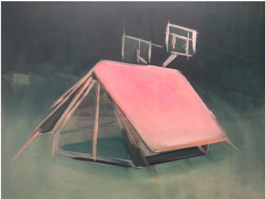
Tente et basket , acrylique sur toile, 55 x 46 cm, 2023