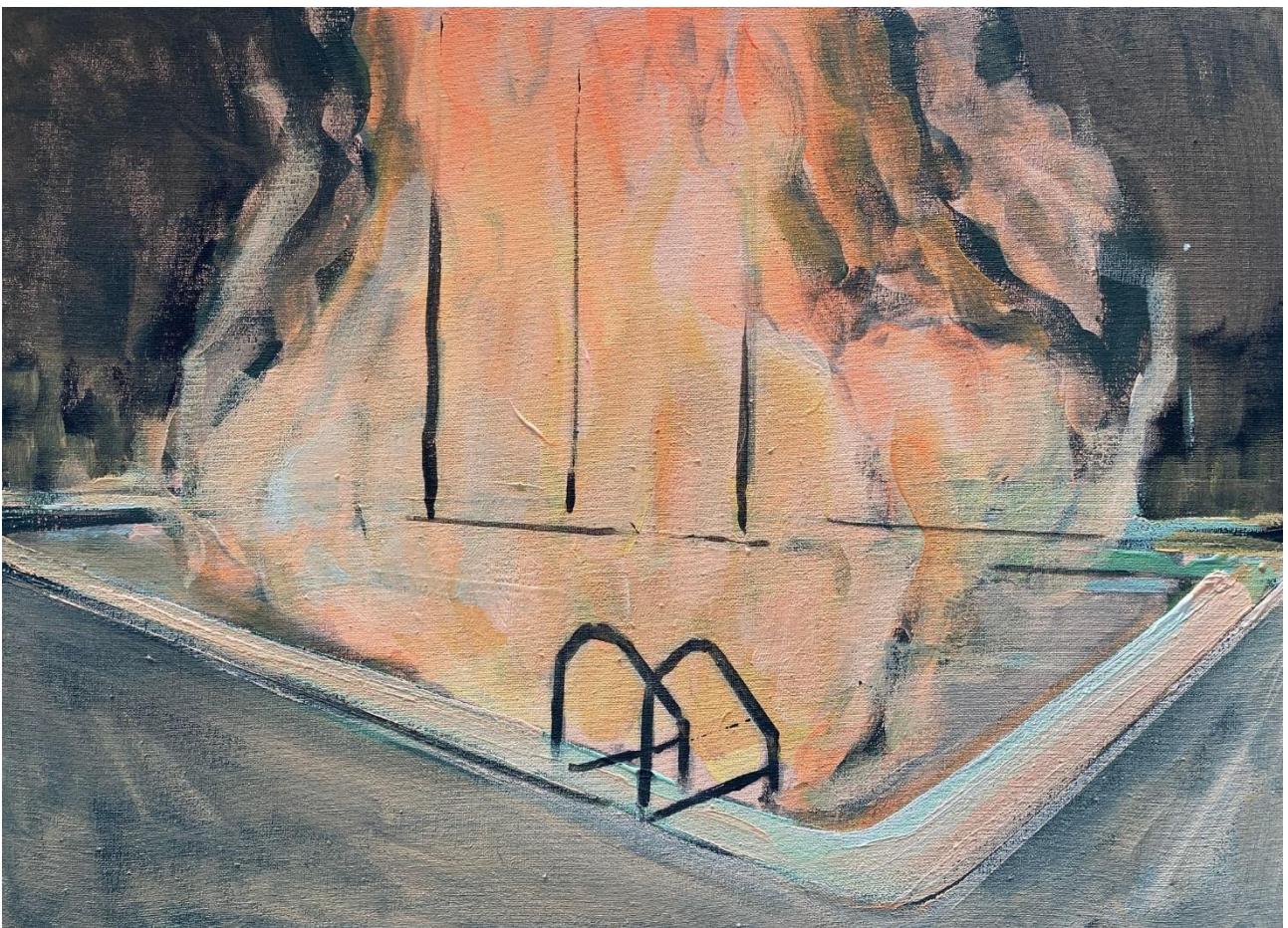
Marie Vandooren, Embracement , acrylique sur toile, 24 x 33 cm, 2024