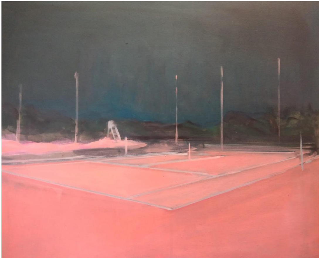
Tennis nuit , acrylique sur toile, 55 x 46 cm, 2023